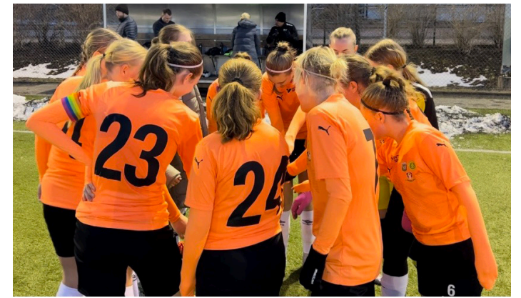
Slutspel DM, innan matchstart mot Halvorstorps IS i Trollhättan.

I år kommer FBS spela i division 4 västra mot bl a nystartade Borås GIF och Annelunds IF men också IF Elfsborgs u-lag. En spännande serie med lag vi inte mötte förra året. Ett F30-lag är också anmält till seriespel. Förbundet ser över sammansättningen av lag efter geografiskt avstånd innan motståndare är klara.