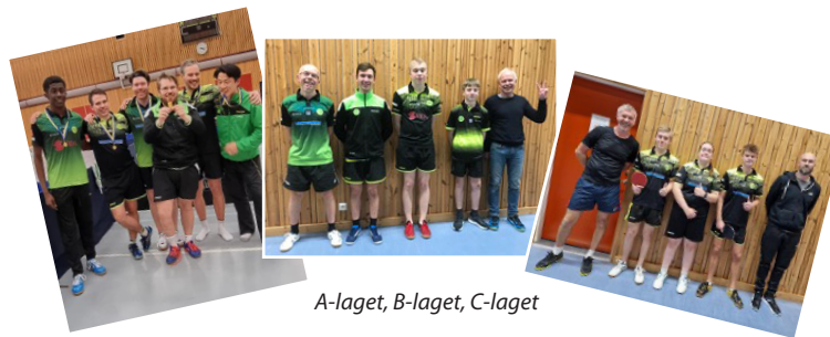
A-laget, B-laget, C-laget

Till sommaren blir det troligen även lite läger för en del spelare, härligt att intresset hänger i även i sommartid! Träningarna startar upp i slutet augusti/början av september som vanligt.